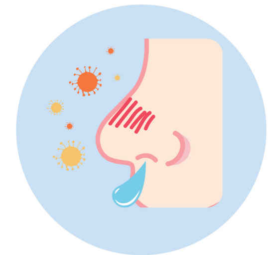
RUNNY NOSE SECRECIÓN NASAL