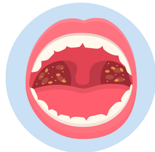
WHITE SPOTS MANCHAS BLANCAS